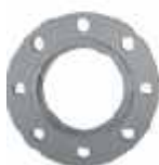
Kołnierze aluminiowe Tw1 DN 80 Tw3 DN 100