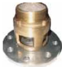
Przeziernik SG 4" kołnierz okr gły / gwint zew.