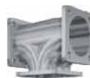
Trójniki aluminiowe z kołnierzami 3"