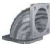
Kolana aluminiowe z kołnierzami 3"