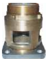
Przeziernik SG 3" Kołnierz kwadrat / gwint zew.