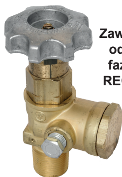
Zawór kątowy odcinający fazy ciekłej REGO 7550P