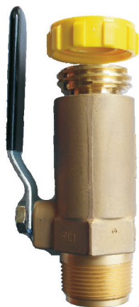
Zawór napeln. double check REGO 7501